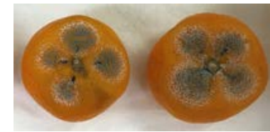
納豆菌によるカンキツ緑かび病の抑制効果 左図: 納豆菌処理 右図: 滅菌水処理(対照区)