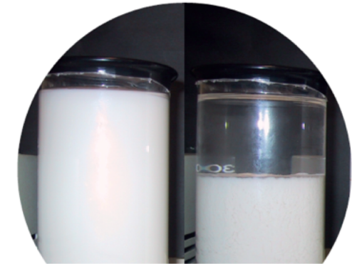
フロックが形成され沈降していく様子