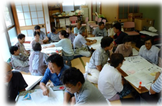
ワークショップを活用した住民参加型の地域づくり手法の開発

農村では、過疎・高齢化や混住化などによって地域社会の機能が低下し、耕作放棄地が増えたり、農業水路が十分に管理されなくなったり、様々な問題が生じています。こうした問題を住民自身が話し合っ解決し、地域を活性化していくための計画手法を研究しています。